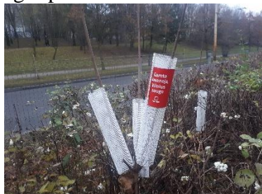
1 pav. Savaime išaugusio medžio žymėjimas

28. Savaime išaugusių medžių žymėjimas (techninės specifikacijos 2 priedo 4.81 punktas). Vertingų, perspektyvių medelių žymėjimas, uždedant ant kamienų plastmasinį tinklėlį su miesto logotipu.